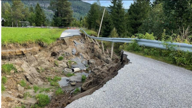
Skader på kommunal veg